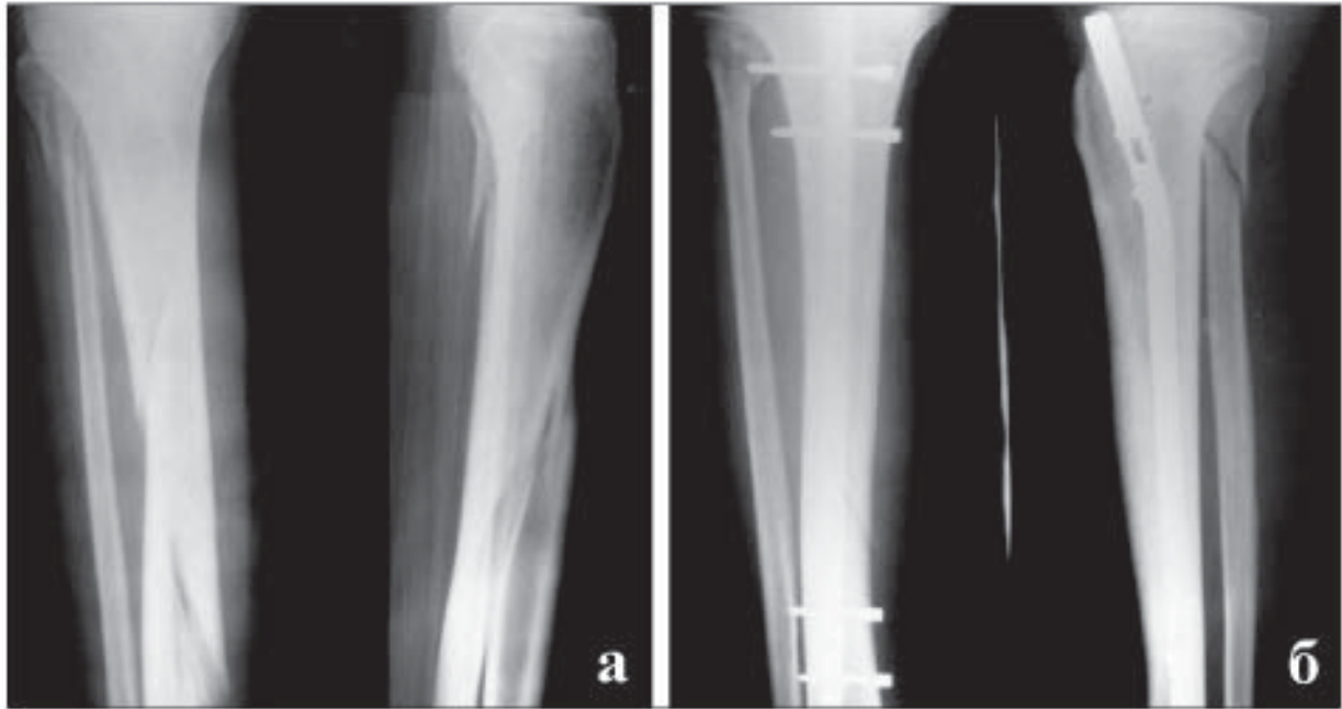
Рис. 1. Рентгенограми переламів кісток правої гомілки хворого М: а – до операції; б – після операції.