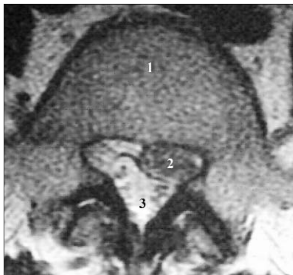
Рис. 1. Магнітно-резонансна томограма поперекового відділу хребетного стовпа: 1 – тіло поперекового хребця; 2 – хребцевий отвір; 3 – грижа міжхребцевого диска.

хребця основою (рис. 2.). У нормі співвідношення ширини тіла хребця (CD) і передньозаднього розміру каналу (DE) становить 2 до 1. Розмір АВ відповідає фронтальній ширині хребетного каналу і, по суті, може бути умовно взятий за основу рівнобедреного трикутника ABE відповідного поперекового перерізу хребетного каналу. Площа рівнобедреного трикутника відповідає половині добутку висоти (DE) на основу отвору (AB). Знання розмірів площі просвіту хребетного каналу принципово важливе для об'єктивізації ступеня стенозу. Будь-яку зміну просвіту хребетного каналу в бік зменшення можна вважати стенозом.