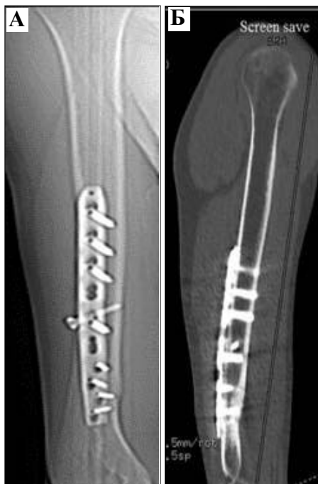
Рис. 2. Комп'ютерна томограма хворого Б. через 5 місяців після металеостіосинтезу (пояснення в тексті).

правій ПК з утворенням періостальних мозолів; клінічно констатовано повне відновлення функції верхньої кінцівки. За шкалою Constant-Murley Shoulder score – 100 балів.