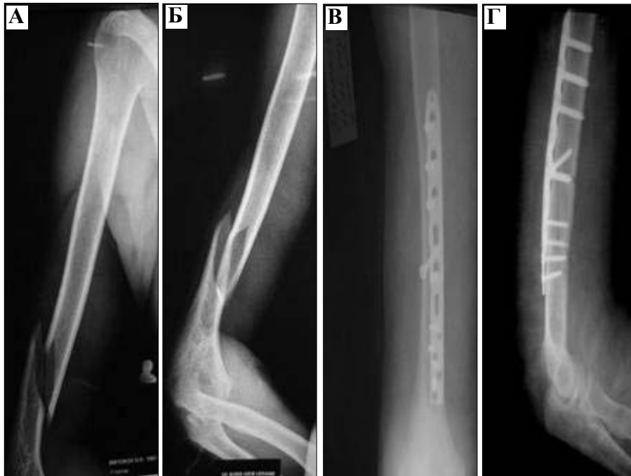
Рис. 1. Фоторентгенограми плечової кістки у хворого Б. при госпіталізації (А – пряма проекція; Б – бокова проекція) та після металеостіосинтезу пластиною з кутовою стабільністю (В – пряма проекція; Г – бокова проекція).