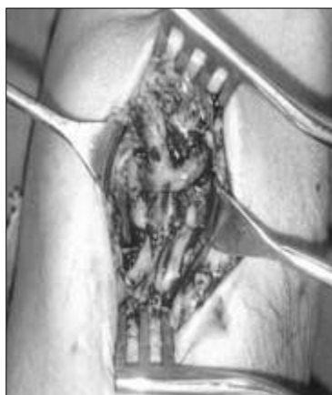
Рис. 1. Артериовенозная фистула с v.perforantia в локтевой области.

Результаты исследования и их анализ. Сосудистый диаметр, измеренный при помощи УДС, составлял: для v.cefalica и v.basilica на предплечье и в локтевой области – 2,1 \pm 0,21 мм, a.radialis до бифуркации – 1,7 \pm 0,43 мм, a.brahialis в нижней трети плеча – 3,1 \pm 0,17 мм. Исходя из полученных данных 39 (48,1%) пациентам созданы дистальные АВФ без последующих реконструкций. Многоэтапные попытки создания СД были произведены у 42 (51,8%) пациентов, в 11 (13,5%) из которых были сформированы АВФ в локтевой области (рис. 1). Истощение (отсутствие) сосудистых резервов вследствие многократных попыток создания СД были установлены у 24 (29,6%) пациентов, которым была