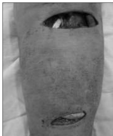
Рис. 2. Артериовенозная фистула с использованием ПТФЭ на предплечье.