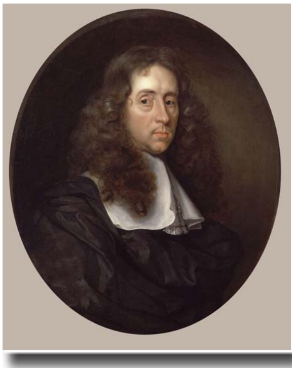
Рис. 1. Натаниэль Гаймор (1613-1685).