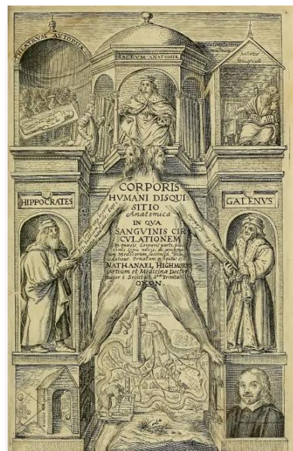
Рис. 2. Титульная страница труда Н.Гаймора «Corporis Humani Disquisitio Anatomica» (Гаага, 1651).

Главный труд его жизни «Corporis Humani Disquisitio Anatomica» (рис. 2), изданный в Гааге в 1651 году, – один из самых значимых медицинских трактатов XVII века. Это первый учебник по анатомии, в котором теория кровообращения Уильяма Гарвея изложена как принятый факт (Osler W., 1957).