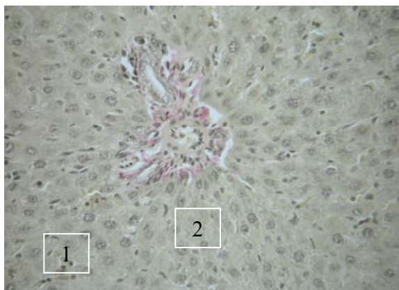
Рис. 1. Морфологічні зміни у щурів 2-ї групи. Лімфоцитарна інфільтрація, фіброзні тяжі, білкова дистрофія цитоплазми, некрози; 1 – лімфоїдна інфільтрація; 2 – білкова дистрофія цитоплазми «пуста» цитоплазма, некрози. Забарвлення за Ван Гізеном. \times 400 .

Аналіз морфологічних досліджень печінки дослідних щурів, показав наступне: у тварин контрольної групи спостерігалась нормальна цитоархітектоніка печінкової тканини. Морфологічно у тварин 2-ї групи (з індукованим ХГ) відмічалось збереження цитоархітектоніки печінки, повнокров'я, візуалізувалось розширення портальних трактів з помірно круглоклітинною лімфоцитарною інфільтрацією синусоїдів, підвищенням вмісту плазматичних клітин (сателіоз). Прикордонна пластинка не пошкоджена. У перипортальній ділянці рідко виявляли гепатоцити з еозинофільною дегенерацією та некрозом гепатоцитів. Зустрічалась осередкова дрібно-, середньокрапельна жирова дистрофія гепатоцитів. При ШИК-реакції виявлена «пуста» цитоплазма, при фарбуванні за Ван Гізеном – фіброз портальних трактів, спостерігаються виразні тяжі сполучної тканини, роз'єднання гепатоцитів (рис. 1).